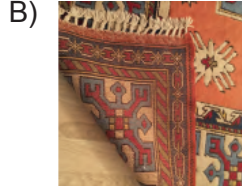
Türk motifleriyle süslü el dokuması halı