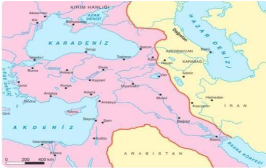
Kasr-ı Şirin Antlaşmasına Göre Osmanlı - Safevi Sınırı