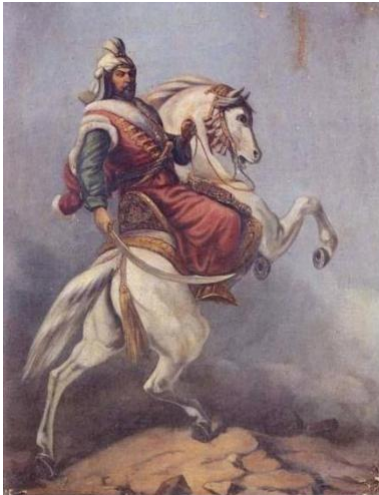
Sultan Murad IV - Sultan Murad IV