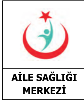
AİLE SAĞLIĞI MERKEZİ